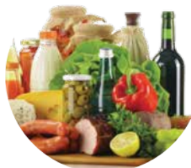
Żywność i napoje